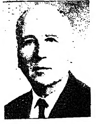
بقلم : الدكتور والتر ايتان

وتفس هذا يقال ، مع الاسف ، عن « السلام الشامل » الذي يعلن الكثيرون من اعداء اسرائيل انه مطلبهم الوحيد ..